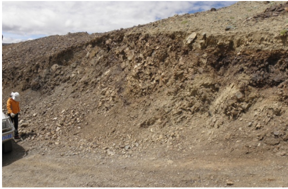
图 2 扎西岗村 A 型褶皱断裂系 (右手 110°)