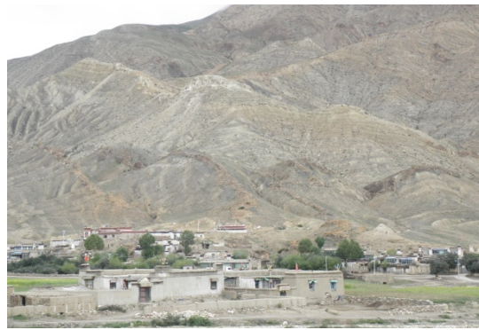
图 3 柯月 A 型褶皱控矿断裂系 (右手 100°)

印度板块低角度俯冲到拉萨板块之下, 导致藏南位置高于正常地壳, 形成藏南拆离系。同时由于摩擦生热, 导致地壳中下部位发生熔融, 随着印度板块进一步俯冲, 高喜马拉雅地块被南北向的继续挤压, 使地下熔融物质聚集和向上侵入地层, 在藏南拆离系内形成大小不一的核杂岩, 呈带状分布。在扎西康矿区南部的淡色花岗岩的核杂岩, 由于前期构造运动破坏原来岩层的稳定性, 流体侵入使岩层之间粘聚力进一步减少, 岩层之间滑脱形成一系列的 A 型褶皱。同时通过 A 型褶皱之间形成的滑脱面 (破裂带), 成矿物质侵入地层, 成矿物质流体对原来黄铁矿进行熔融改造, 形成方解石脉、闪锌、石英、黄铜矿, 而后又进行第二次改造, 第三次改造, 形成隐爆角砾岩 (矿石), 最后形成铅锌锑银多金属矿床。扎西康铅锌矿属于多期次中低温液改造沉积型矿床。