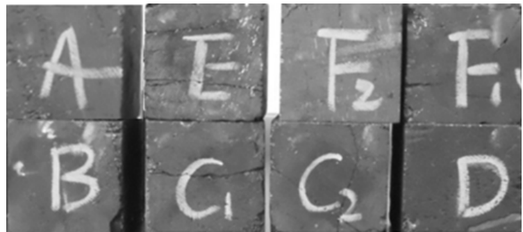
图 2 待测煤样