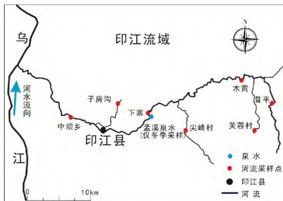
图 2 印江河流域采样位置示意图

喀斯特小流域印江河水样品的采集工作分 2014 年丰水期(7 月)和枯水期(12 月)两次进行。采样点布设于印江河的干流和支流,其中干流主要包括芙蓉村、木黄、下寨和中坝乡;支流主要有昔平、尖峰村和子房沟(图 2)。每个采样点每次采一个样品。