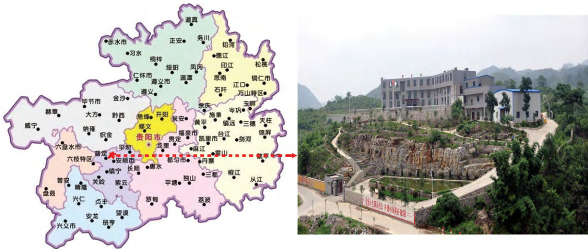
图1 普定站的地理位置及主站址外观