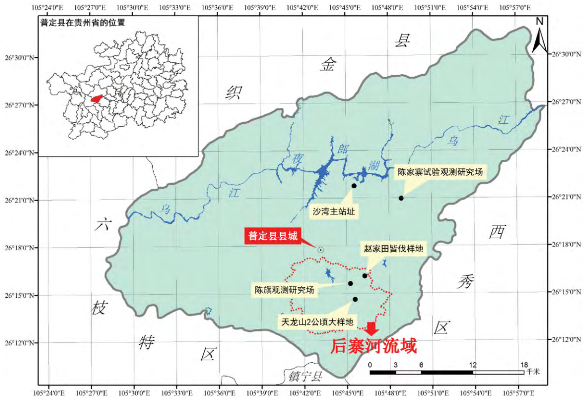
图 2 普定站生物监测样点分布图